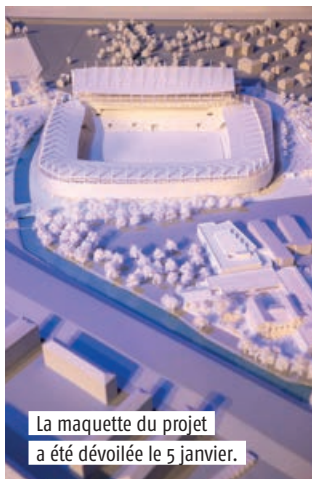
La maquette du projet a été dévoilée le 5 janvier.

FOOTBALL Les travaux de restructuration-extension du stade de la Meinau débuteront en mai 2022, la jauge passant de 26 000 à 32 000 places. Le projet choisi, celui de Populous (associé à l'agence strasbourgeoise Rey-De Crécy), se veut exemplaire sur le plan écologique (énergies renouvelables, structures en bois pour la fan zone...) et sur celui de l'insertion dans le quartier. Populous a réalisé le Parc OL à Lyon et rénové, outre-Manche, le stade de Wembley. Le coût du projet s'élève à 100 M€ HT: 50 M€ financés par l'Eurométropole (propriétaire du stade), 25 M€ par la Région, 12,5 M€ par la Ville et 12,5 M€ par la nouvelle Collectivité européenne d'Alsace. ● T.P.