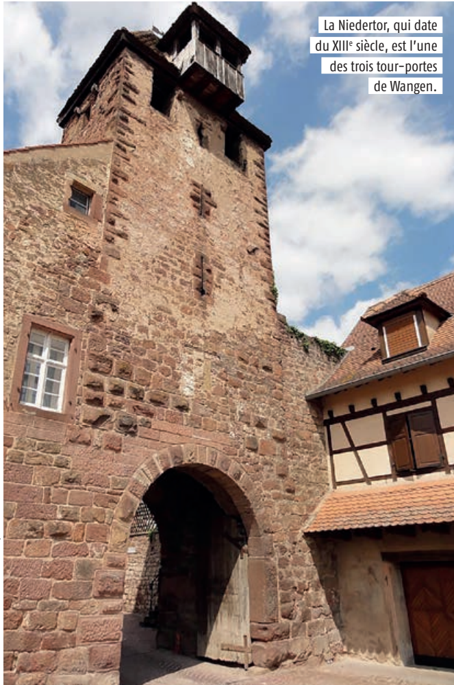
La Niedertor, qui date du XIII e siècle, est l'une des trois tour-portes de Wangen.