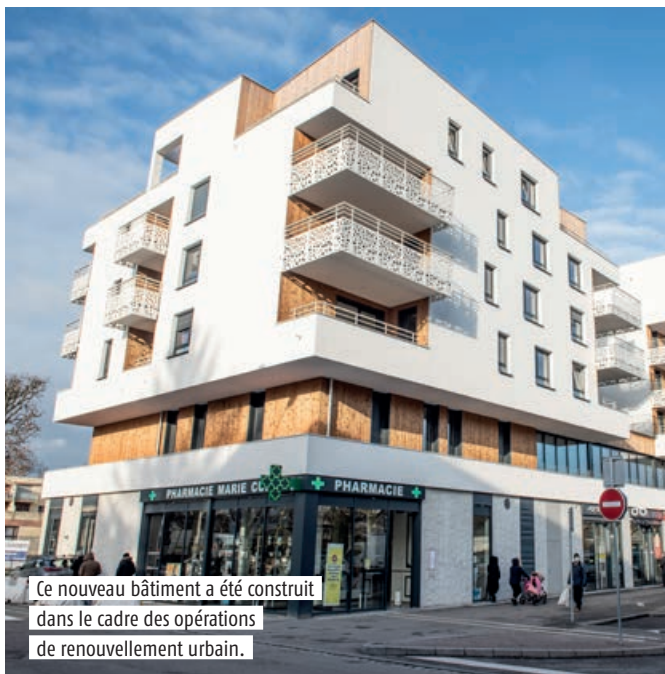
Ce nouveau bâtiment a été construit dans le cadre des opérations de renouvellement urbain.