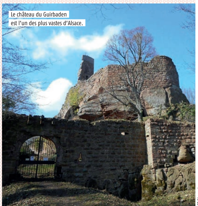
Le château du Guirbaden est l'un des plus vastes d'Alsace.

[ INFO + ] Plus d'infos sur www.sauver-le-guirbaden.fr