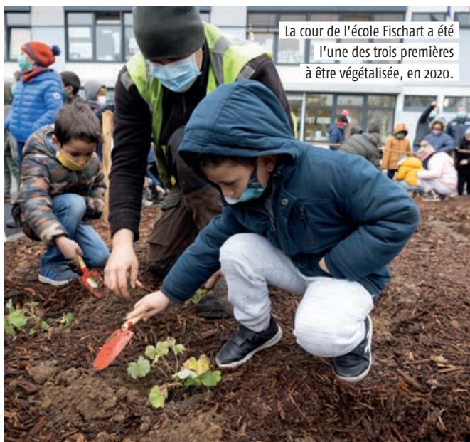
La cour de l'école Fischart a été l'une des trois premières à être végétalisée, en 2020.

La Ville débute des concertations publiques pour végétaliser sept nouvelles cours d'écoles et de structures de la petite enfance.