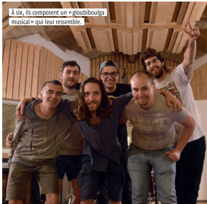
À six, ils composent un «gloubiboulga musical» qui leur ressemble.

MUSIQUE C'est l'histoire de six musiciens, réunis autour d'une passion commune et devenus amis à force de jouer et de se produire ensemble. Mix de leurs prénoms à tous, le nom de leur groupe, les Redmaco and The Juliens, donne le ton. Celui d'un éclectisme assumé qui donne à leurs chansons une couleur tout à fait à part. « On est chacun venu avec notre style propre et on construit des morceaux avec les inspirations des uns et des autres. C'est une démarche très punk mais qui