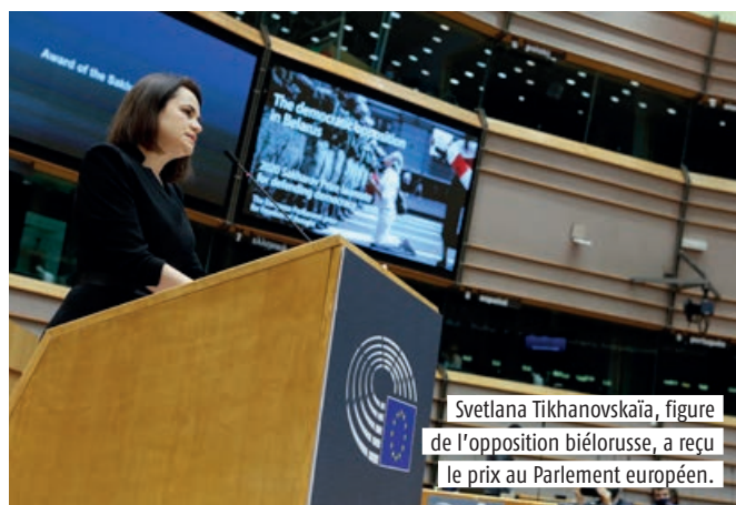
Svetlana Tikhanovskaïa, figure de l'opposition biélorusse, a reçu le prix au Parlement européen.

DÉMOCRATIE La Biélorussie traverse une crise politique depuis les élections présidentielles entachées de fraudes. Des milliers de manifestants, représentés par Svetlana Tikhanovskaïa, candidate défaite à l'élection, demandent le départ du président Alexandre Loukachenko et poursuivent leur mobilisation face à une répression violente. « Le Parlement européen reconnaît l'opposition biélorusse comme représentante légitime de la population », a expliqué Heidi Hautala, vice-présidente du Parlement en charge des droits de l'Homme, lors d'une conférence donnée mi-décembre à l'occasion de la remise du prix Sakharov. Ce dernier s'accompagne en outre de l'intégration dans « une communauté qui regroupe tous ses lauréats et qui est aujourd'hui unie