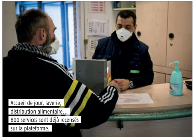
Accueil de jour, laverie, distribution alimentaire... 800 services sont déjà recensés sur la plateforme.

fixe. Accueil de jour, bagagerie, épicerie sociale, laverie, douches, accompagnement social, services de santé, dispensaire pour les animaux... Environ 232 lieux et 800 services sont déjà recensés, avec la possibilité de les localiser sur une carte et des informations comme les horaires d'ouverture ou le numéro de téléphone. Soliguide, en partie traduit en anglais, en arabe et en espagnol, comporte aussi une messagerie. «Grâce à un outil de traduction, les