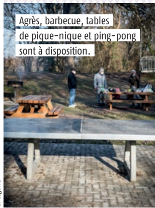
Agrès, barbecue, tables de pique-nique et ping-pong sont à disposition.