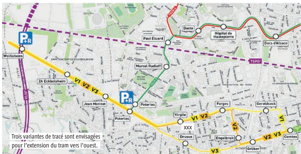
Trois variantes de tracé sont envisagées pour l'extension du tram vers l'ouest.

[ INFO + ] Pour participer à la concertation : réunion publique virtuelle le 3 février ; via les registres en mairies de quartier et sur participer.strasbourg.eu