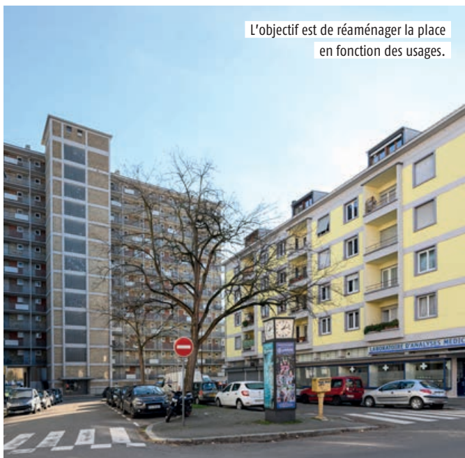
L'objectif est de réaménager la place en fonction des usages.