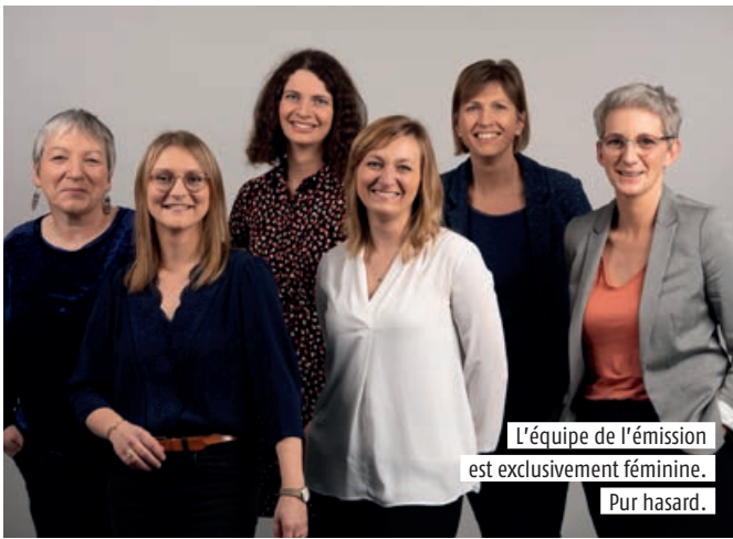
L'équipe de l'émission est exclusivement féminine. Pur hasard.

Rendez-vous emblématique de France 3 Alsace, Rund Um a fêté ses trente ans il y a quelques semaines.