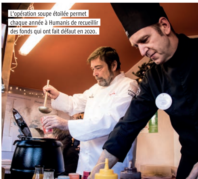
L'opération soupe étoilée permet chaque année à Humanis de recueillir des fonds qui ont fait défaut en 2020.

[ INFO + ] la-maraude-du-partage.assoconnect.com , dons à déposer au 27 rue du Fossé des Tanneurs