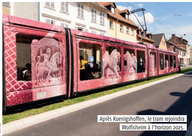
Après Koenigshoffen, le tram rejoindra Wolfisheim à l'horizon 2025.

Désormais inscrite dans la feuille de route mobilité de l'Eurométropole, l'extension du tram vers l'ouest est soumise à concertation.